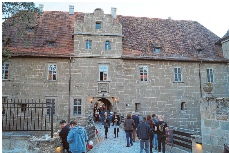
Die Weigenheimer waren zum Rockabend auf Schloss Frankenberg mit kostenlosem Essen und Getränken eingeladen.