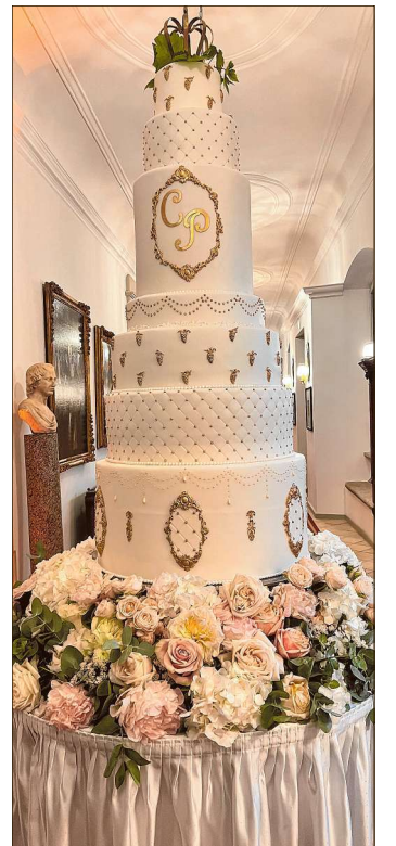
Die zweieinhalb Meter hohe Hochzeitstorte wurde dem Modell von Paris Hiltons Hochzeitstorte nachempfunden.